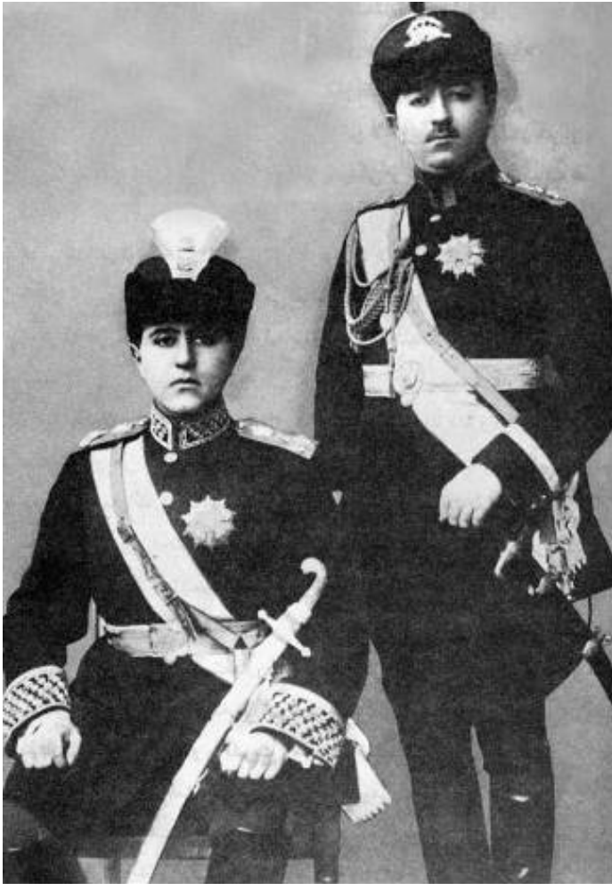
احمدشاه و محمدحسن میرزا ولیعهد