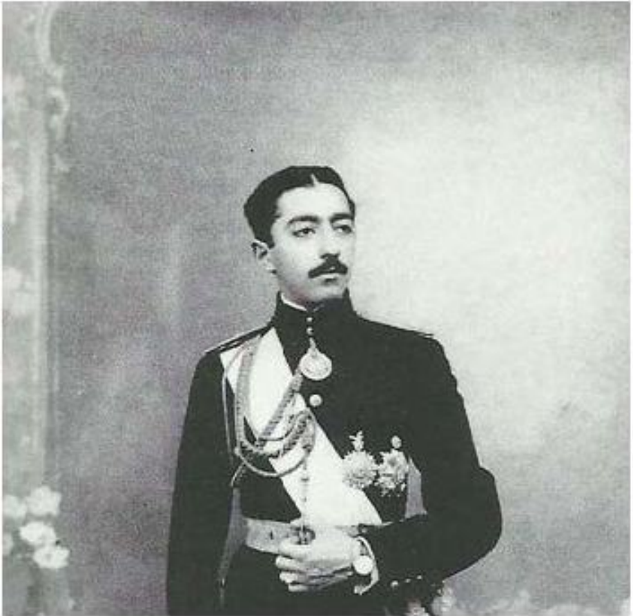
محمد حسن میرزا. آخرین ولیعهد قاجاریه