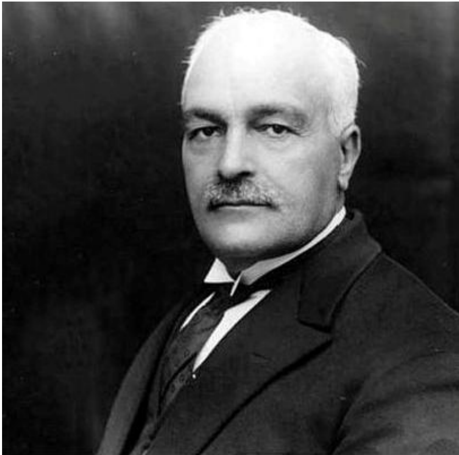
ارباب کیخسرو شاهرخ