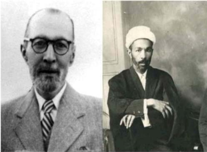
ملک الشعراء بهار