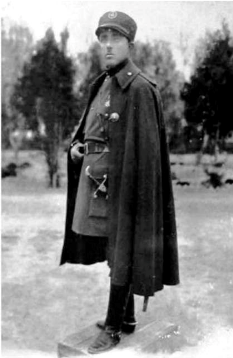
امیر لشکر عبدالله خان امیر طهماسبی