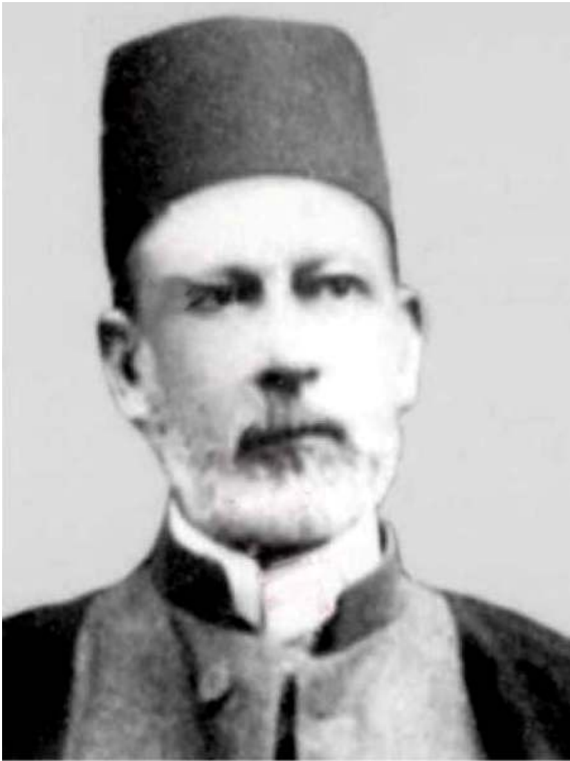
میرزا حسین خان مؤتمن الملک