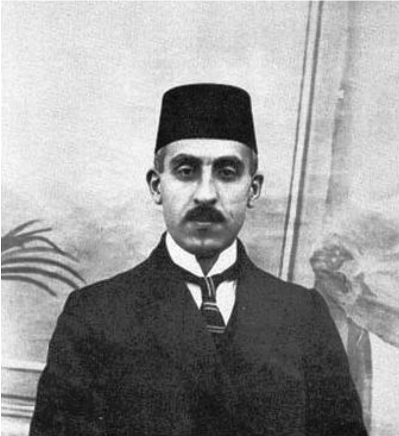
دکتر محمد مصّدق السلطنه