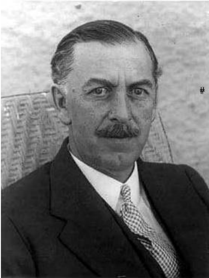
سر پرسبی لورن (Sir Percy Loraine)