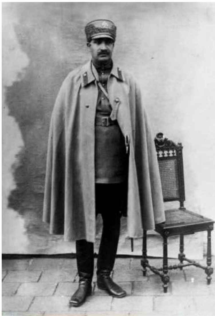
رضاخان سردار سپه