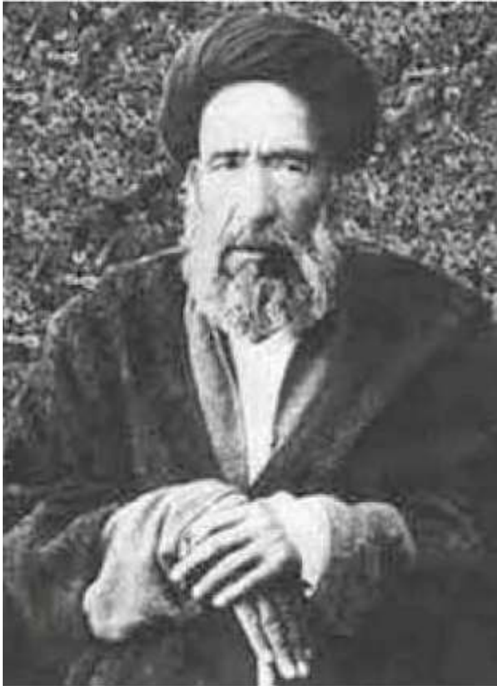
سید حسن مدرس