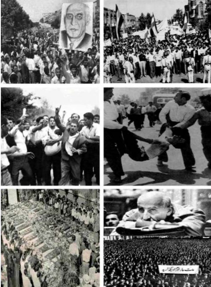
بمناسبت سالروز قیام ۳۰ تیر ۱۳۳۱