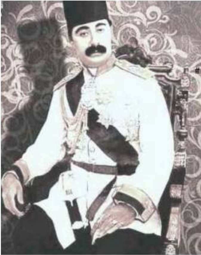
مرتضی قلی خان اقبال السلطنه مگوی