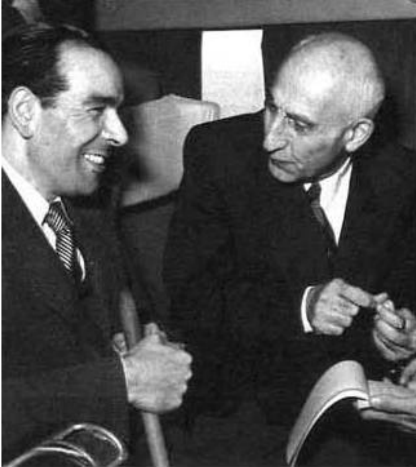
دکتر محمد مصدق - دکتر حسین فاطمی