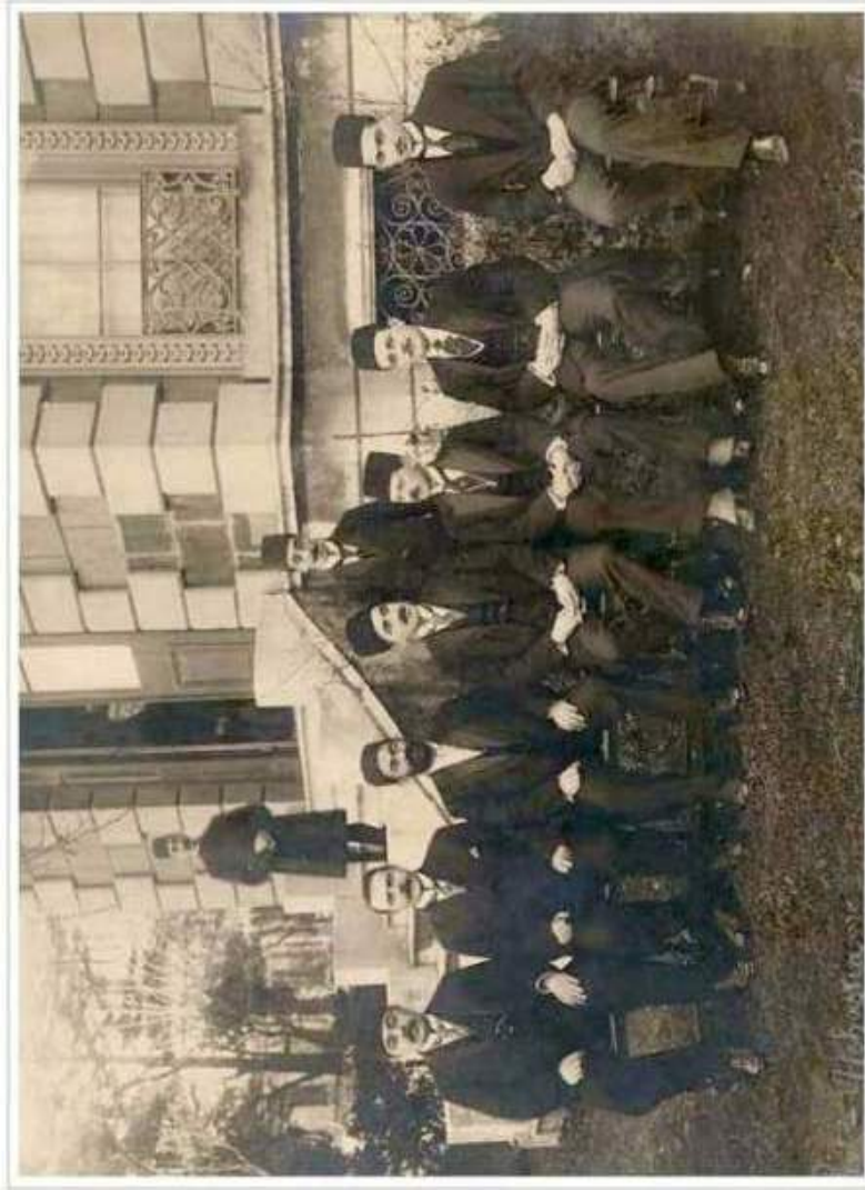
فرسفرات ایران در استانبول از چپ : مخم السلطنه، آتوف برتس، محمد علی فروغی ، احتشام السلطنه، میرزا حسین خان ( حسین علاء) - ۷ ژانویه ۱۹۱۹